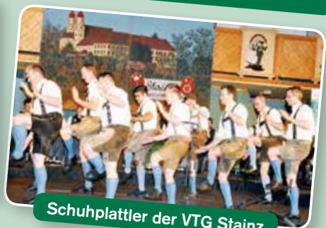
Schuhplattler der VTG Stainz