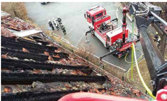
Von den Feuerwehrleuten wurden Höchstleistungen erbracht.