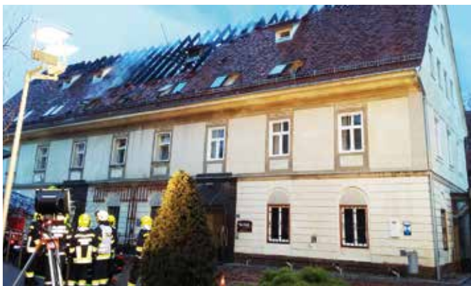
Das Feuer richtete große Schäden an der Hofer Mühle an.

Immer wieder stellt sich auch die Frage, wie die Gemeindeämter weiter genutzt werden. Hier einige Antworten: Das Gemeindeamt Marhof wurde an die Firma Reinbacher/Schranger verkauft. Im