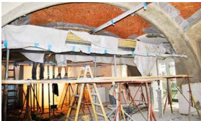
Auch dem Denkmalschutz wird Rechnung getragen.