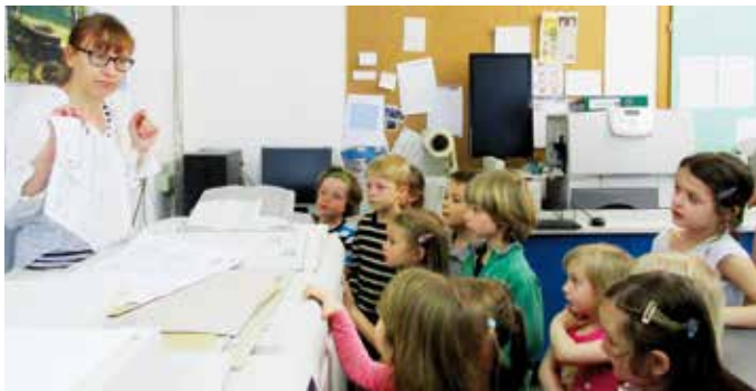
Besuch vom Druckhaus Stainz