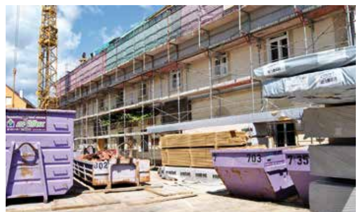
Die Aufbauarbeiten sind in vollem Gange.