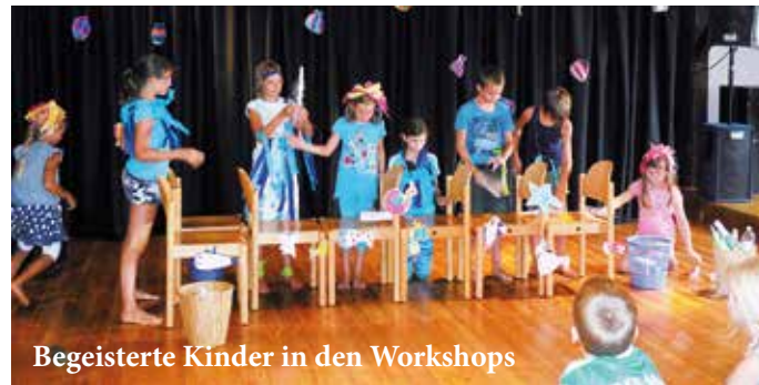
Begeisterte Kinder in den Workshops