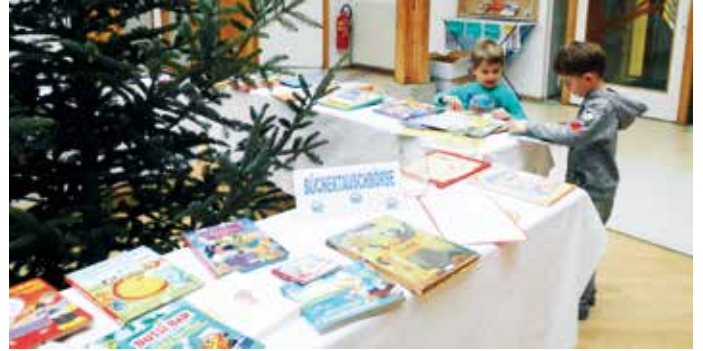
Büchertauschbörse zu Weihnachten