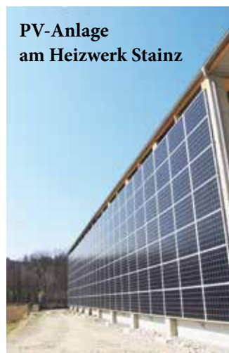
PV-Anlage am Heizwerk Stainz

Die SUREnergy GmbH betreibt bereits eine 190kW PV Anlage am Heizwerk in Pichling. Der Sitz der Gesellschaft ist in Fladnitz an der Teichalm. Mit Ihren Tochterfirmen errichtet die SUREnergy Bürgerbeteiligungsanlagen in der Steiermark - zB. In Hitzendorf, Weiz, Birkfeld, Pöllau, Mortantsch, Bad Gleichenberg und weiteren Orten.