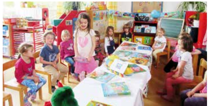
Ich zeig dir mein Lieblingsbuch