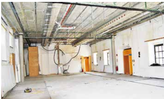
Technisch wird die Mühle auf den letzten Stand gebracht.