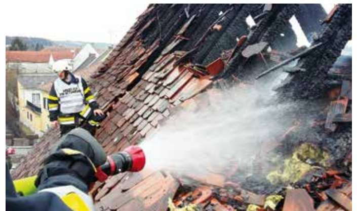
Es war ein unglaublich toller Einsatz unserer Feuerwehren.