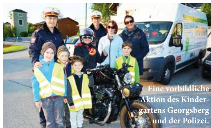
Eine vorbildliche Aktion des Kindergartens Georgsberg und der Polizei.