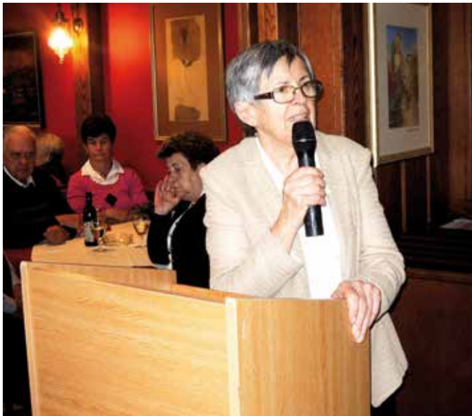
Die Obfrau begrüßt die Anwesenden

Die Obfrau dankte abschließend noch für die Gestaltung